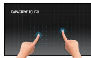
Touch Technologie - Kapazitiv

Die IPS-Displays sind vor allem für weite Betrachtungswinkel und natürliche, hochgenaue Farben bekannt. Sie eignen sich besonders für farbkritische Anwendungen.