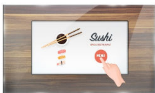
Touch durch Glas

Der 15.6 (39.5 cm) ProLite TF1615MC-B1 verwendet die PCAP-Touch-Technologie und ist verbaut in einem formschönen Edge-to-Edge Glas Design. Dank seiner Glasauflage und dem robusten Rahmen garantiert der Bildschirm eine hohe Haltbarkeit und Kratzfestigkeit und ist somit ideal für Kiosksysteme und Anwendungen im öffentlichen Einsatz geeignet. Ausgestattet mit einer Schaumstoffdichtung bietet das Gerät eine nahtlose Integration in Kiosksysteme. Mit der IP65 Zertifizierung bietet das Gerät eine Staub- und Wasserresistenz in der Bedienung. Die Ausrichtungsoptionen Quer- Hoch- und Face-Up-Format sorgen für flexible Montagemöglichkeiten, dazu kann es mit separat erhältlichen Befestigungswinkeln ( OMK5-1 ) ausgestattet werden, die den Einbau erleichtern. Die ideale Lösung für Kiosksysteme, industrielle Umgebungen, Kontrollräume und interaktive Multimedia-Anwendungen.